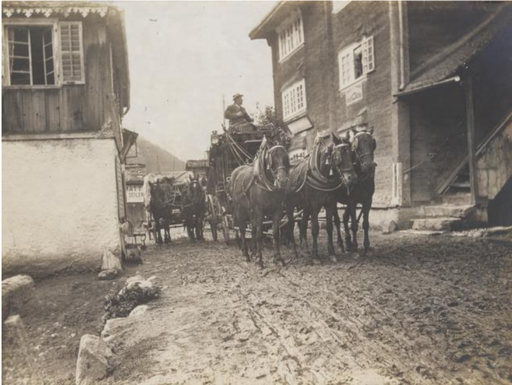
1912: Postkutsche in Blitzingen im Goms