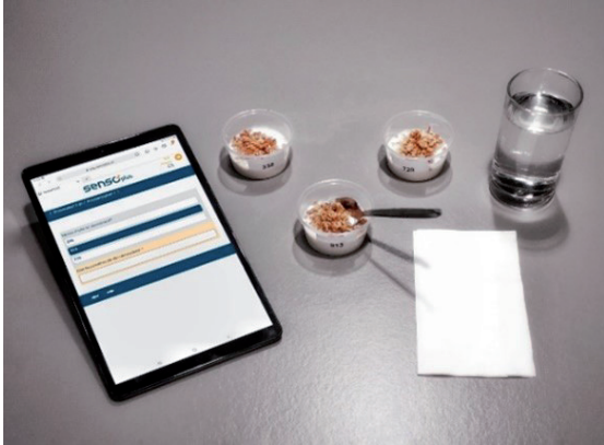
Mit SensoPLUS dem Geschmack auf der Spur

susanne.aegler@sensoplus.ch +41 41 710 71 61 www.sensoplus.ch