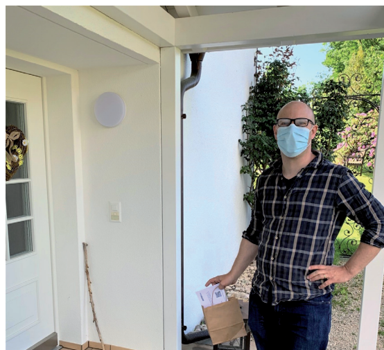
Konsumenten-Insights trotz Corona-Lockdown

Üblich und zukunftsweisend ist vielerorts zudem das Generieren von eigenen Daten über unternehmenseigene Online-Communities. Die Einbindung der Verbraucher erfolgt hier vorwiegend digital über den kompletten Produktentwicklungsprozess hinweg. Sowohl bei der Ideenentwicklung, den Prototypen-Tests, als auch nach einem Kauf sorgen automatisierte Kundenumfragen für ein schnelles Feedback, das direkt in die Weiterentwicklung des Produktes einfließt.